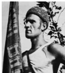
NADA ZA SEĆANJE (L'ESPOIR POUR MÉMOIRE), JORGE AMAT, (CHRONIQUE DES BRIGADES INTERNATIONALES EN ESPAGNE: 1936-39), 2x55', 2003.

Tokom trajanja građanskog rata regionalna vlada Katalonije (Generalitat) je pokrenula velike filmske kampanje preko svoje produkcijske kuće "Laya Films". Između marta i juna 1939. godine ova kompanija je proizvela brojne filmske žurnale "España al día" (Španija danas) zajedno sa drugom filmskom kompanijom "Film Popular". Kompanija je takođe proizvela više dokumentarnih filmova o samom ratu (Jornadas de victoria: Teruel, 1938. - Dani pobjede, Teruel), zatim o surovosti protivnika sa ciljem da ih diskredituje (Catalunya martir, 1938 - Mučenička Katalonija) i o aktivnostima vlade, kulturi i radu u Kataloniji (Danzas catalanas y aragonesas, 1936-1937 - Igre i plesovi Katalonije i Aragona) da bi se Katalonija prikazala međunarodnoj javnosti kao region obrazovanih i radnih ljudi.