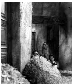
ŽIVOT U SENCI (VIDA EN SOMBRAS), LORENZO LLOBET-GRÀCIA, 90', 1949.

izazovima u jednom zatvorenom i neprijateljskom okruženju. Ne mogavši da slobodno izaberu svoje puteve, primorane su da žive živote satkane od snova, zamišljanja, sećanja ispred svojih prozora.