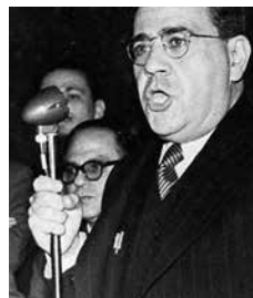
GRAĐANIN NEGRIN (CIUDADANO NEGRÍN), IMANOL URIBE, CARLOS ÁLVAREZ Y SIGFRID MONLEÓN, 85', 2010.

Ono što je zaboravila i o čemu mi nije govorila bili su španski rat, izgnanstvo u Francuskoj, povratak sa gerilcima u Barselonu, zatvor, bekstvo i ponovno izgnanstvo u Fransku. Čitav njen život pronalazi se na njenim platnima i crtežima. Na filmu se smenjuju politički događaji sa doživljajima (iskustvima) moje majke sa završnom scenom mitinga u Madridu.