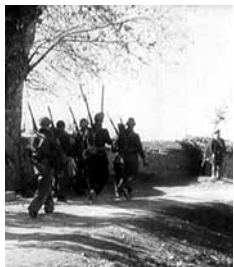
DOKUMENTARNI FILMOVI IZ ARHIVA KATALONSKE KINOTEKE 60', 1937.

Film predstavlja adaptaciju istoimenog romana jedne od najznačajnijih katalonskih književnica, Merse Rodoreda (Mercè Rodoreda) u kojem se jedan trg Barselone, kao mesto zbivanja, preobražava u metaforu istorije jedne zemlje u njenom ratnom i poratnom razdoblju.