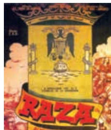
RASA (RAZA), JOSÉ LUIS SÁENZ DE HEREDIA, 103', 1942.

Autor, za razliku od mnogih koji se bave tematikom građanskog rata i frankizma, umiče banalnosti i konvencionalnosti. Viljarongova perspektiva je uvek originalna i različita, crna i okrutna. Ipak, u poređenju sa njegovim drugim filmovima, Crni hleb je njegov najpristupačniji film (ovo je njegov deveti igrani film), ali ne toliko da se iz njega ne izliva nezdrava i uznemirujuća aroma koja karakteriše njegovo ukupno filmsko delo.