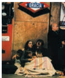
DIJAMANTSKI TRG (LA PLAÇA DEL DIAMANT), FRANCESC BETRIU, 116' 1982.

U ovom dokumentarnom filmu upoznajemo jednu učiteljicu iz tog doba i snimke iz neobjavljenih arhiva, potom putem svedočenja istraživača i srodnika u prilici smo da više i bolje saznamo o jednom istorijskom trenutku kojeg su proživele i obeležile ove žene svojim učešćem i doprinosom preobražaju naše zemlje preko obrazovanja. Zahvaljujući ovom filmu otkrivamo jedno prekrasno nasleđe koje su nam ostavile republikanske učiteljice.