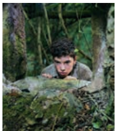
CRNI HLEB (PAN NEGRO / PA NEGRE), AGUSTI VILLALONGA, 108' 2010.

Reditelj Agustí Villaronga smešta radnju ovog filma, koji predstavlja adaptaciju čuvenog romana Crni hleb katalonskog pisca Emili Teixidor-a, u ruralni ambijent Katalonije neposredno po pobedi frankizma. Nosilac ove priče je dečak kroz čije oči gledalac otkriva i prati ovu dramatičnu povest. Viljaronga nas uvodi u dečakov unutrašnji svet i iskustva preko kojih pratimo njegovo sazrevanje ispunjeno besom i razočaranjima koje će ga pretvoriti u jednu destruktivnu i monstruožnu zver.